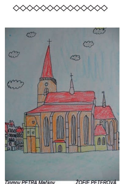
Domov PETRA Mačkov