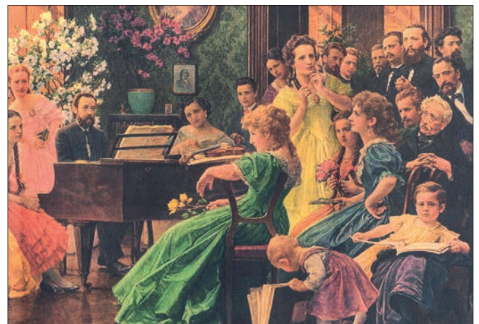
Smetana s přáteli na obraze Františka Dvořáka (1923)