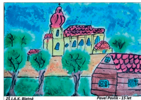
23 J.A.K. Blatná