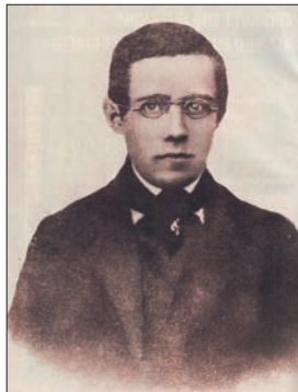
Mladý Friedrich Smetana (první Smetanova fotografie)

v podání Kosatíka na plno objevovat, a s ním i širší souvislosti jeho životní dráhy - českou a evropskou hudební scénu, společenský život či vazby na české národní obrození.