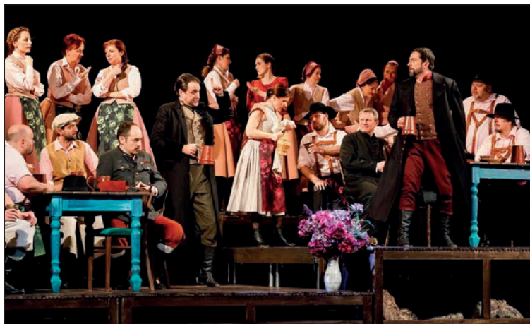
Malina, Kalina a spol. v opeře Tajemství (v podání Jihočeského divadla)

k hudebním výšinám v evropském měřítku, ale české publikum mu opakovaně dalo najevo, že jeho „wagnerovské“ vzlety nehodlá tolerovat. Proto byla jen vlažně přijata třeba opera Dalibor , a o to větší úspěch slavily prostonárodní „komické opery“ jako Prodaná nevěsta či Hubička , které se staly oním národním hudebním pokladem, i když si je sám Smetana tolik necenil.