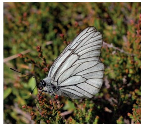
J. Walter: Bělásek ovocný ( Aporia crataegi ), Šumava, červenec 2020