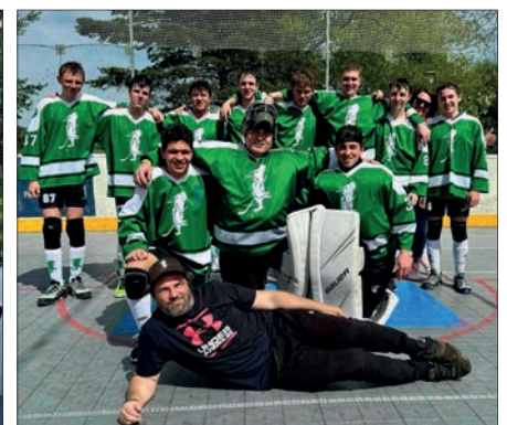
Dorost po vítězství nad Prachaticemi!