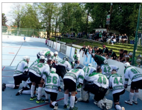
Áčko Datels po vítězství nad Pedagogem!