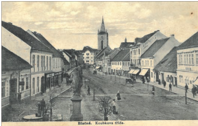
Koubkova třída.