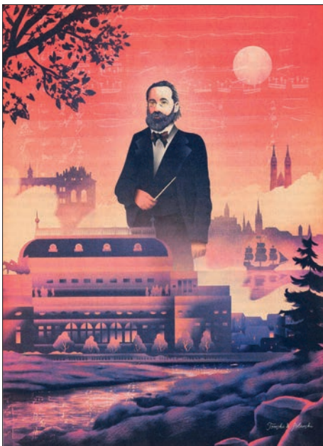
Plakát k letošnímu smetanovskému výročí

zdá se, že letošní rok je ve znamení „znovu-objevování“ Bedřicha Smetany (1824 – 1884). Ne snad, že by byl tento velikán naší hudby zapomenut, ale výročí 200 let od jeho narození vidí mnozí jako výbornou příležitost nově promyslet a nastudovat něco z jeho díla, napsat nové odborné i popularizující studie, uspořádat vedle tradiční Smetanovy Litomyšle další festivaly – prostě vyžít z tohoto výročí co nejvíc. Je tu celý košatý projekt Smetana200, točí se film, do oslav se zapojují nejen koncertní domy a hudební tělesa všeho druhu, ale taky třeba Hurvínek se Spejblem a Máničkou