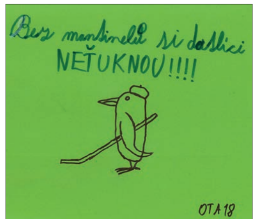
I Datláci chtějí nové mantinely!