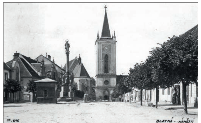
Dnešní náměstí Míru.