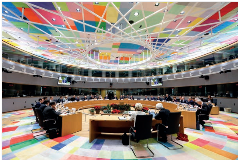
Takto vypadá zasedání Evropské rady

jině: v roli předsedající země chceme přispět ke zvládnutí uprchlické vlny, nabídnout řešení všech možných aspektů energetické krize, posílit obranné kapacity Evropy nebo také zvýšit odolnost evropských ekonomik a demokratických institucí. To vše pod mottem „Evropa jako úkol“, vypůjčeném od Václava Havla, a s logem v podobě kruhu barevných kosočtverců, trochu připomínajícím nějaký indiánský náhrdelník.