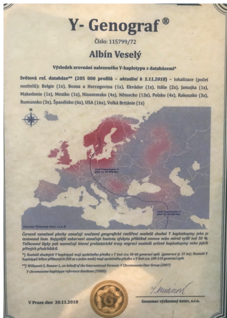
Albín Genograf II.

Srdeční hudba pro Albína III. je Bluegrass. Původní vznik je ze severní Evropy ... Irsko, Skotsko, Dánsko a Genograf určitě nelže. Sám