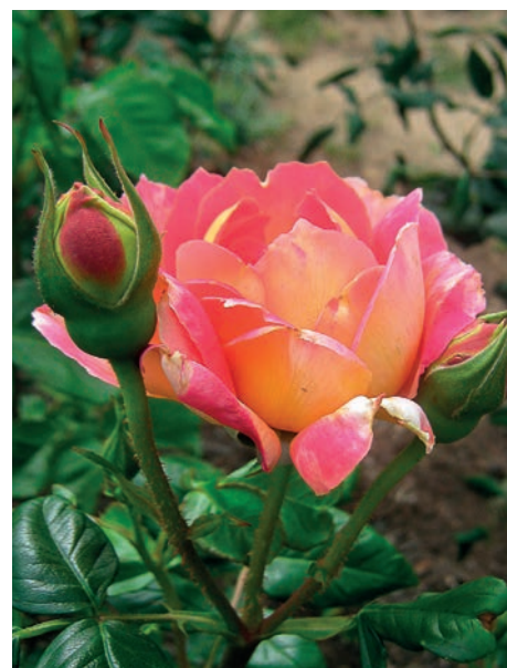
Condesa de Sástago (1930)