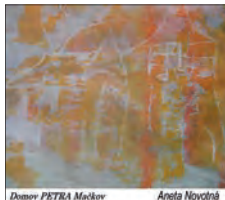
Důmov PETRA Maškov

Hledám pomocníka na údržbu zahrady v Blatné Tel. 603 504 048