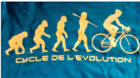
Jedna z hezkých představ o evoluci člověka