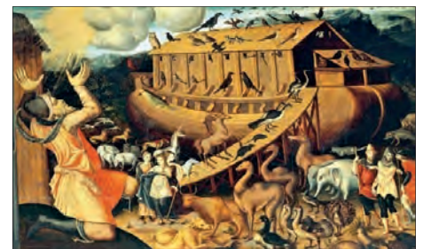
Příběh o Noemovi může být také podobensvím o genetických základech lidstva

Moje sliny takto putovaly do Texasu, do společnosti My Heritage, a teď už to vím: skladba DNA mě řadí z téměř 50% na Balkán, další silné stopy vedou do Skandinávie a na Balt, jen málo společného mám s východní Evropou a ještě méně s Evropou jižní. Neprotestuji, i když je mi trochu záhadou, jak k tomu dospěli – jsem si vcelku jist, že moji předci se po několik generací motali prakticky výhradně v jižních a východních Čechách. Inu, možná si kdysi dávno někdo z nich odskočil na Balkán. Docela mě ovšem potěšilo zjištění, že geneticky se mi nejvíce