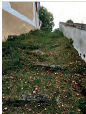
BEZDĚDOVICE-PAŠTIKY - Stav před rekonstrukcí - pohled od návsi v Paštíkách na balvany tvořící schodiště

Požadavek byl osvětit dostatečným způsobem celé schodiště. Na podzim a v zimě si to hlavně návštěvníci koncertů a jiných akcí pořádaných v kostele pochvalovali. Po tlaku