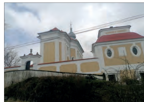
BEZDĚDOVICE-PAŠTIKY - Skutečný pohled na kostel

opět tvrdí autorka, bych podotknul, že tato fotografie vznikla naprosto účelově a byla spojená s neoprávněným vstupem na zamčený a oplocený soukromý pozemek. Pevně doufám, že majitel tuto troufalost nenechá bez povšimnutí. Jedná se o sklad stavebního materiálu soukromé firmy. Majitel kdykoliv