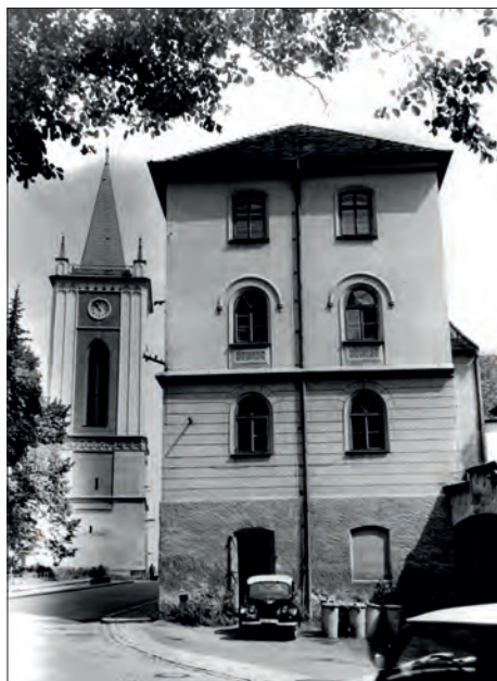
Budova s výstavními prostorami Městského muzea v Blatné, 1974. Fotografická sbírka Městského muzea Blatná (Fo95/17)

Co se týkalo znovuobnovení muzea v souladu s předpisy a zákonem kromě řádné inventury sbírkového fondu bylo zapotřebí s nadřízenými orgány vyjednat jeho budoucí podobu. Ty rozhodly, že z dřívějšího městského muzea bude zřízen k 1. 1. 1974 Památník města Blatné jako pobočka Muzea středního Pootaví ve Strakonících (dále jen MSP) a bude sídlit v dosavadních prostorech, tedy na náměstí Míru 212. Památník se po nut-