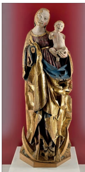
Mistr Zvíkovského Oplakávání, Assumpta, Muzeum Blatná, kol. 1510-1520

regionu – Panna Maria s Ježíškem (Assumpta) z hlavního oltáře v kostele Nanebevzetí Panny Marie v Blatné, nemáme zřetelné zprávy o tom, pro jaký sakrální prostor byly skulptury z jeho dílny původně objednány, např. Panna Maria s Ježíškem z Kocelovic, Assumpta, sv. Kateřina a sv. Barbora z Černínska (spojení s tvrzí v Uzeničkách, jejímž majitelem byl sice na počátku 16. století Zdeněk Lev z Rožmitálu, je neprůkazné), které byly nepochybně součástí monumentálnější