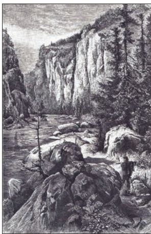
Údolí Vltavy u Nevěže na kresbě A. Levého z 2. poloviny 19. století

Vrcholem knihy je „virtuální plavba“ po staré Vltavě se stručným popisem všech zajímavých míst mezi Týnem nad Vltavou