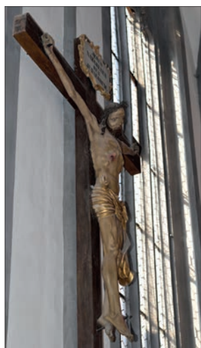
Ukřížování, kostel Nanebevzetí Panny Marie v Blatné, kol. 1520

ností jeho dílna přednostně pracovala pro Zdeňka Lva z Rožmitálu a jeho manželku Kateřinu Švihovskou z Rýzmburka. Nevíme ovšem, jak se jmenoval, kde se přesněji vyškolil, kde sídlila jeho extrémně produktivní dílna atd. Navíc, až na určité výjimky v našem