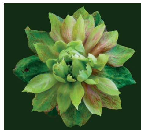
Zelená růže ( Rosa chinensis viridiflora )