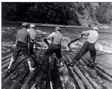
Plavci na voru v peřeji

a Štěchovicemi. „Plujeme“ tišinami i dravými proudy (včetně Svatojánských), řeka se