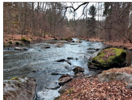
Lomnice před soutokem se Skalicí, únor 2022