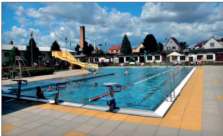
Od roku 2013 mají občané a návštěvníci Blatné možnost relaxovat v příjemném areálu nově vybudované letní plovárny, která má otevřeno od června do zří