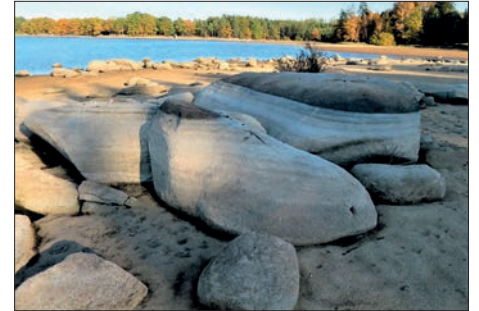
Balvany na dně polovypuštěné Velké Kuše, říjen 2020

zvláštní, že zeměpisný záběr těchto knih je dán rozsahem bývalého soudního okresu blatenského (do roku 1960), a tedy nekoresponduje úplně jak s povodími, tak třeba se současnými krajskými hranicemi. Ale má to svoji logiku, už třeba s ohledem na dostupnost