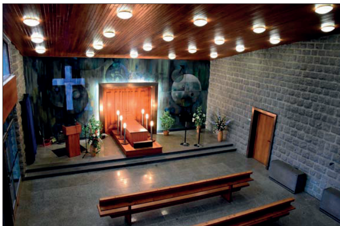
TSMB poskytují kompletní servis v pohřebnictví. Obřadní síň s mottem „Jak kapky jsme se rozpršeli a jako déšť jsme vsákli v zem“ patří k nejhezčím v republice