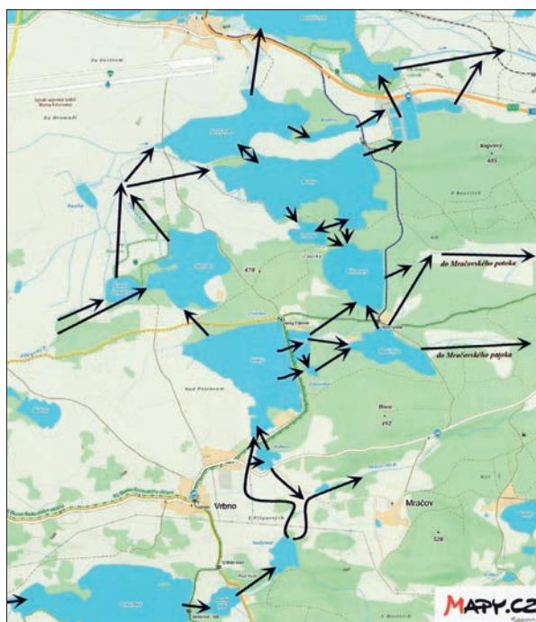
Mapka mračovsko-pálenecské rybníční soustavy (z knihy Rybníky na Blatensku, 2. díl)

Na Blatensku naopak krajina – nejen podle mého soudu – tvoří harmonický celek a rybníky v tom hrají důležitou roli. Samy o sobě jsou krásné v každé roční době, jiné kouzlo mají za úsvitu, v poledne, za soumraku a v noci, za jasného i pošmurného větrného dne, ale především utvářejí celkový ráz krajiny Blatenska snad víc, než cokoli jiného. Když tedy chcete pochopit Blatensko, musíte nejprve zvládnout rybníky. Je zajisté užitečné vědět něco o geologii a geomorfologii, o lesnictví a zemědělství, ale hlavně musíte porozumět vodo-pisu - odkud a kam voda teče