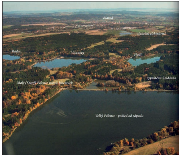
Letecký pohled od Velkého Pálence k Blatné (z knihy Rybníky na Blatensku, 2. díl, foto Jan Kurz)

První dvě knihy se věnují právě Lnářsku, kde je celková vodní plocha rybníků největší, třetí pak vlastnímu Blatensku. Ty knihy mají tak trochu charakter encyklopedie a nejspíše je nepřčtete jedním dechem. Ovšem dozvíte se v nich leccos o historii jednotlivých rybníků, jejich výměře, délce hráze či objemu zadržené vody, o tom, jak jsou vzájemně propojeny, jak regulují průtok vody krajinou a jak obstály či neobstály při povodních. Neméně pozornosti je pak věnováno hospodářskému využití – tedy jestli jde o rybníky hlavní, komorové, třecí či výtažníky, kolik se do nich nasazuje ryb a jakých, kolik se vyloví atd. A nezapomíná se ani na zaniklé rybníky, jejichž stopy jsou v krajině často stále patrné. Pokud se začínáte bát, že by se vám z té záplavy informací mohla zatočit hlava, vezměte na vědomí, že knihy obsahují také přehledné