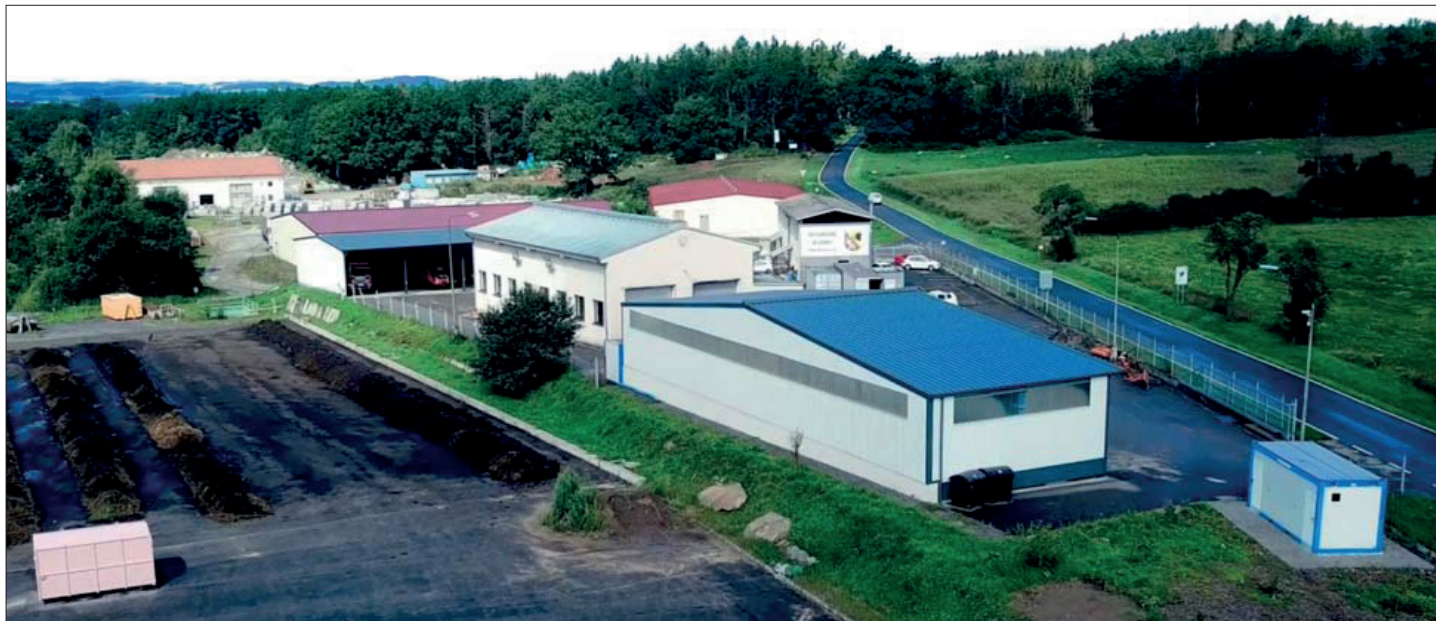
V areálu TSMB je administrativní budova (vpravo nahoře), garáže, prostory pro opravy techniky, sklad posypových materiálů, kompostárna, sběrný dvůr a re-use centrum

Již v roce 1974 se začala psát historie Technických služeb města Blatné (dále TSMB), které byly založené před téměř padesáti lety jako příspěvková organizace tehdejšího MěstNV Blatná. V roce 1994 se podnik přetransformoval na společnost s ručením omezeným se 100% majetkovou účastí města. Hodnota obchodního podílu činí přes 27 milionů korun.