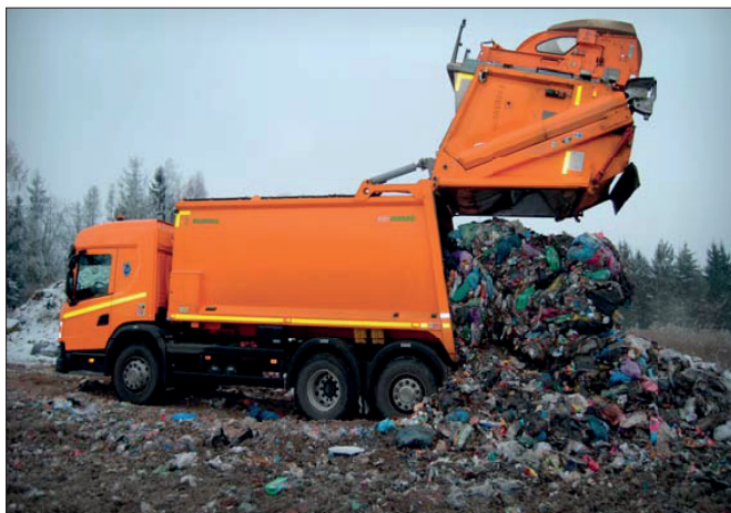
Ke svozu SKO slouží nízkopodlažní vozidlo Scania L 320 s nástavbou Ros Roca Olympus a vyklápěčem Terberg. Odpad končí na nedaleké skládce Hněvkov

„Ojedinělou činností naší společnosti v rámci technických služeb je pohřebnictví.