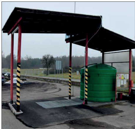
Pro vlastní potřebu si TSMB pořídily v roce 2011 plastovou nádrž na naftu o objemu 5000 litrů. Průběžně sledují cenu této komodity a snaží se využít chvíle, kdy poklesne. Obvykle nakupují v intervalu dvou týdnů 1500 až 2000 litrů. Investice se vrátila za pět let

TSMB svážeji směsný komunální odpad (SKO) z Blatné, okolních osad a obcí v okruhu asi deset kilometrů. K tomuto účelu slouží od konce roku 2018 nízko-podlažní (tzv. low entry, tedy s nízkým nástupem) vozidlo Scania L 320 s pohonem 6 x 2 v agregaci s nástavbou Ros Roca Olympus 20W (objem 20 m 3 , W = širší) a univerzálním děleným vyklápěčem Terberg TCH-DH s mechanickým ovládním. Souprava je v permanenci po čtyři dny v týdnu; vždy dva dny ve městě a dva v jeho okolí.