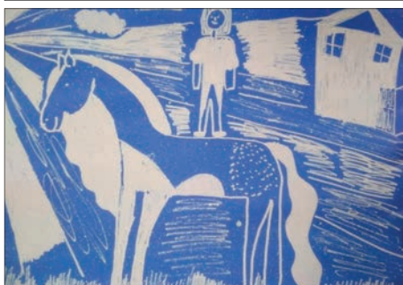
ZUŠ Březnice Zlata Hrachovcová - 10 let