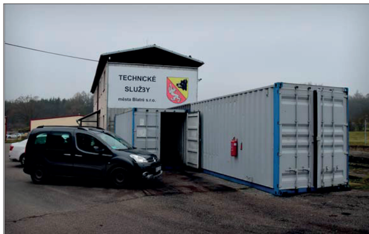
Pro skladování odpadových nádob nebo menší techniky se osvědčily vyřazené námořní kontejnery o objemech od 33 a 67 „kubiků“. Jsou uzamykatelné s uvnitř instalovaným osvětlením